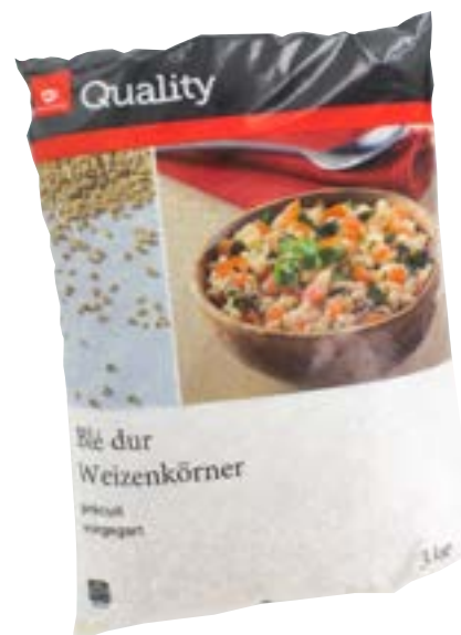
Blé dur précuit 3 kg