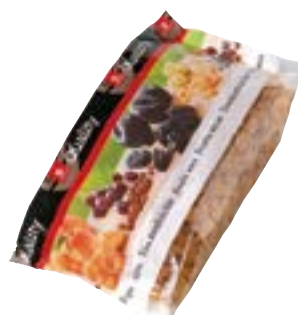
Raisins de Smyrne