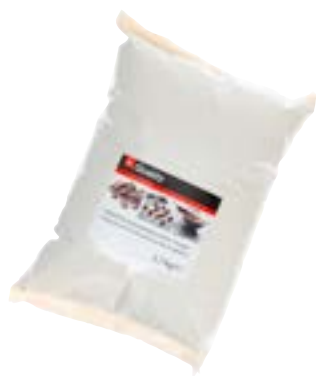
Couverture en gouttes au lait 33%