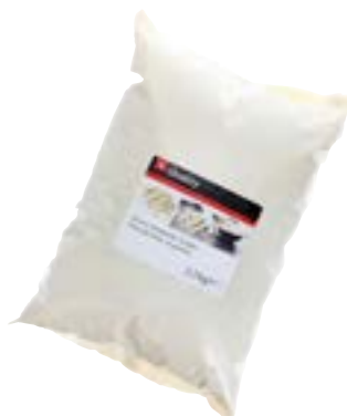
Couverture en gouttes blanches 28%