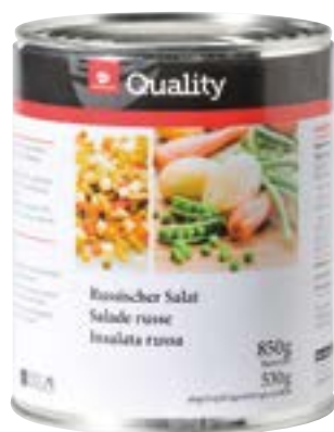
Salade russe 6 x 850 g