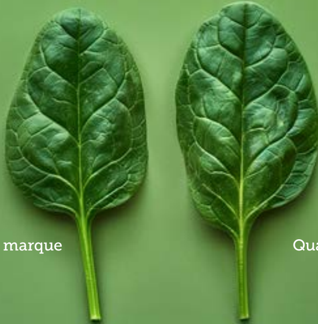
Produit de marque