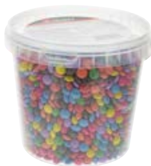
Mini pastilles colorées au cacao