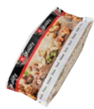
Graines de tournesol