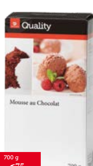
Mousse au Chocolat