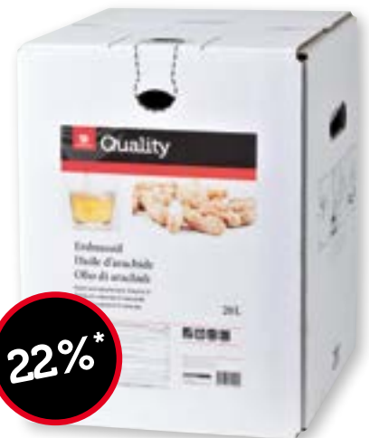
Huile d'arachide 20 l