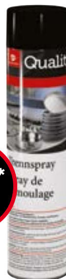
Spray de démoulage