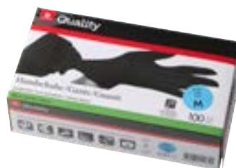
Gants jetables en nitrile taille S - XL noirs