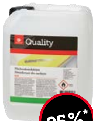
Désinfectant des surfaces