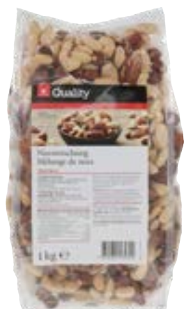
Mélange de noix