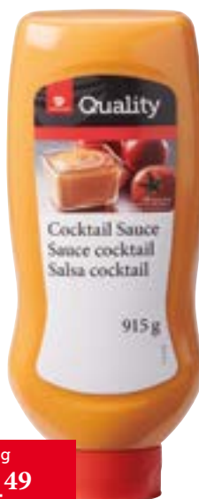
Sauce Cocktail Squeeze