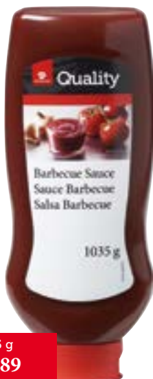
Sauce Barbecue Squeeze