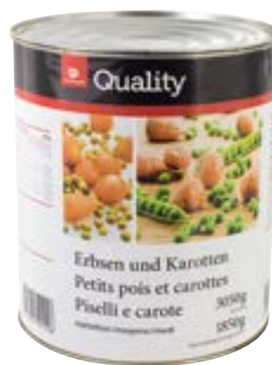
Petits pois et carottes moyens