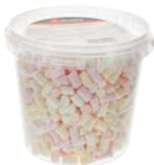
Marshmallows Mix mini