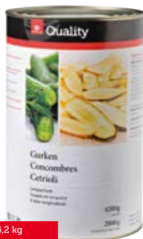
Concombres en tranches