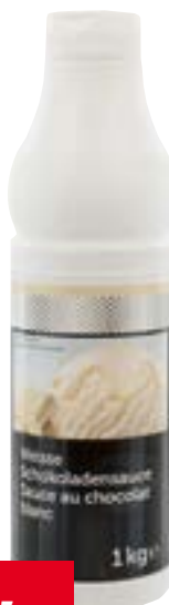
Sauce au chocolat blanc