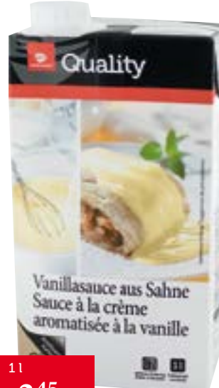
Sauce vanille à la crème