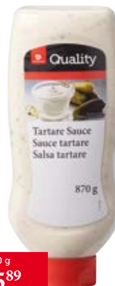
Sauce Tartare Squeeze