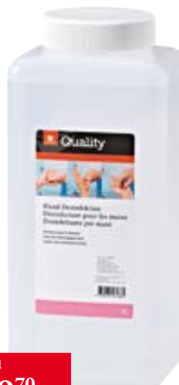
Désinfectant pour les mains