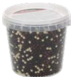
Crispies au chocolat