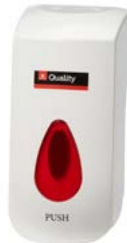
Distributeur de savon et de désinfectant pour les mains