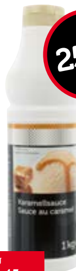
Sauce au caramel