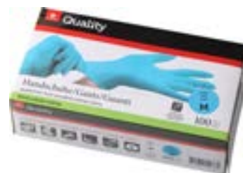
Gants jetables en nitrile taille S - XL bleus