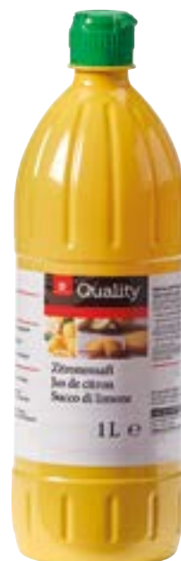
Jus de citron à base de concentré