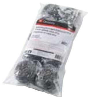
Éponge à spirale