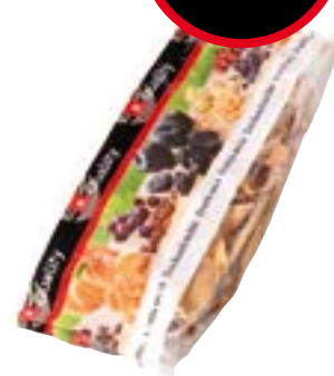
Mangue en tranches sans sucre