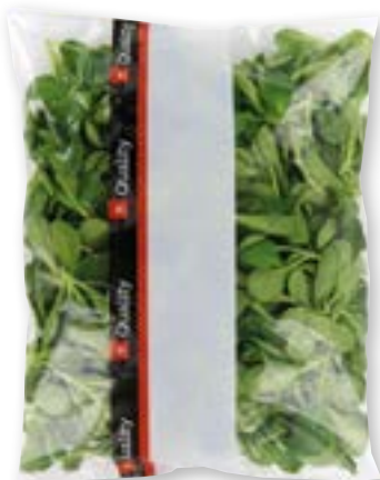
Doucette préparée, lavée

Et vous, vous voyez la différence? Épinards Quality à prix avantageux.