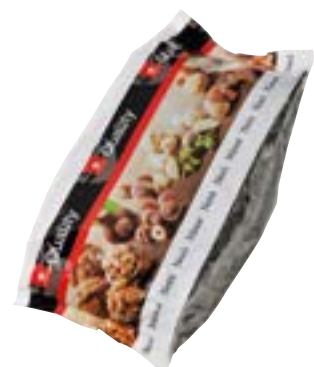
Graines de courge