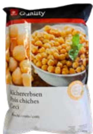
Pois chiches cuits