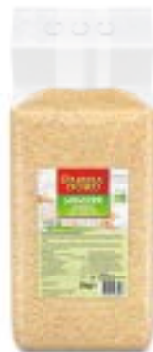
Parmadoro Langkornreis parboiled Parmadoro Riz Long Grain parboiled Parmadoro Riso a chicco lungo parboiled 246390 / 2 × 5 kg