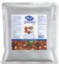
Gulaschsuppe-Konzentrat Potage de goulache concentré Zuppa gulasch concentrato