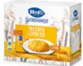
Polenta Express Polenta Express Polenta Express