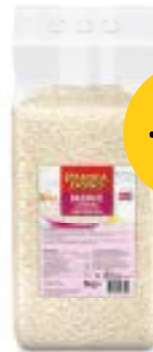
Parmadoro Basmati Reis Parmadoro Riz Basmati Parmadoro Riso Basmati 246380 / 2 × 5 kg