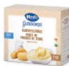
Kartoffelpüree Purée de pommes de terre Puré di patate