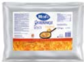
Rösti Feinschnitt Rösti coupés fins Rösti taglio fine