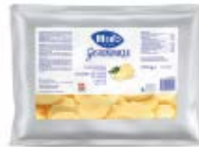
Kartoffeln in Scheiben Pommes de terre en tranches Patate affettate