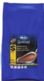
Bratensauce (Pulver) Sauce de rôti liée (poudre) Salsa d'arrosto legata (polvere)