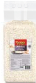
Parmadoro Carnaroli Risottoreis Parmadoro Carnaroli Riz Risotto Parmadoro Carnaroli Riso Risotto 592161 / 2 × 5 kg