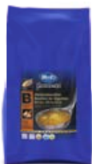
Gemüsebouillon (Pulver) Bouillon de Légumes (Poudre) Brodo di Verdura (Polvere)