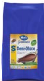
Sauce Demi-Glace Nutrition (LVK) Sauce Demi-Glace Nutrition (LVK) Salsa Demi-Glace Nutrition (LVK)