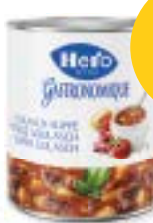
Gulaschsuppe Soupe de goulache Zuppa gulasch