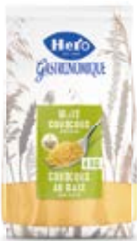
Mais-Couscous glutenfrei Couscous au maïs sans gluten Cuscus de maïs senza glutine