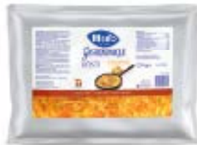
Rösti Grobschnitt Rösti coupé gros Rösti taglio grosso