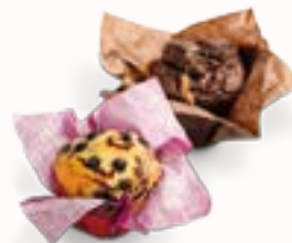
MUFFIN MIX PACCO DA 2 CHOCO & BLUEBERRY,

senza glutine, senza lattosio, surgelato, 10 x 70 g