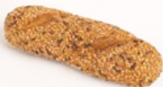
PANINO AI SEMI

senza glutine, senza lattosio, surgelata, 10 x 70 g