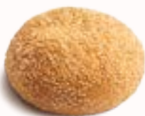
PANINO PER BURGER

senza glutine, senza lattosio, surgelato, 10 x 70 g