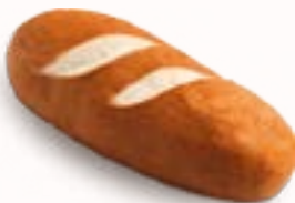
PANINO DI SILS

senza glutine, senza lattosio, surgelato, 20 x 100 g