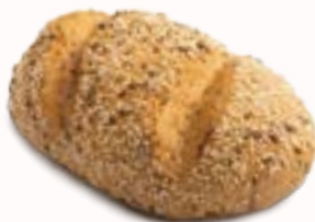
PANE AI SEMI

senza glutine, senza lattosio, surgelato, 10 x 70 g