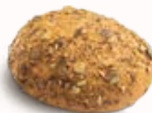
PANINO AI SEMI DI ZUCCA

senza glutine, senza lattosio, surgelata, 20 x 80 g