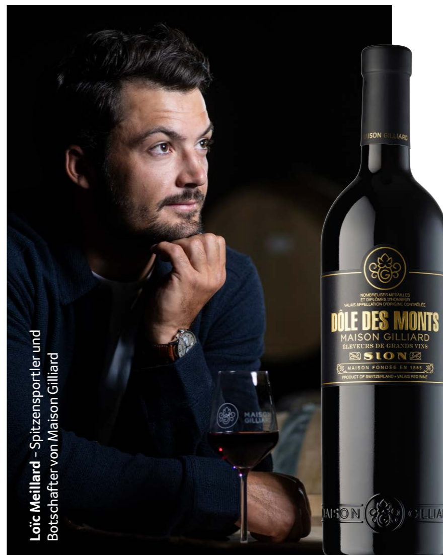
Loïc Meillard – Spitzensportler und Botschafter von Maison Gilliard