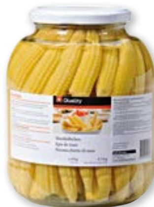
Pannocchiette di mais