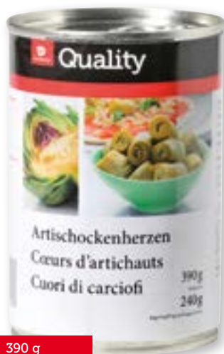
Cuori di carciofi 8-10 pezzi 6 x 390 g