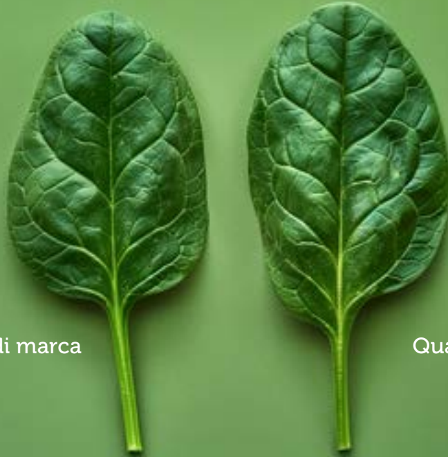
Prodotto di marca