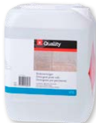
Detergente per pavimenti