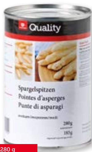
Punte di asparagi medie 12 x 280 g