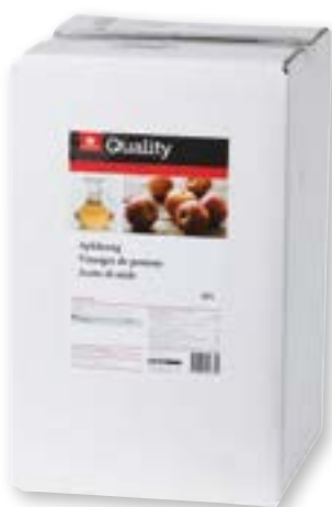
Aceto di mele 10 l