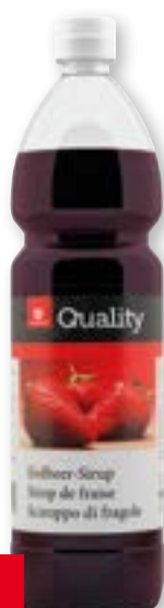
Sciroppo di fragole 11