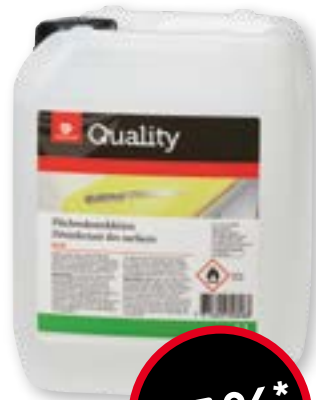
Disinfettante per superfici