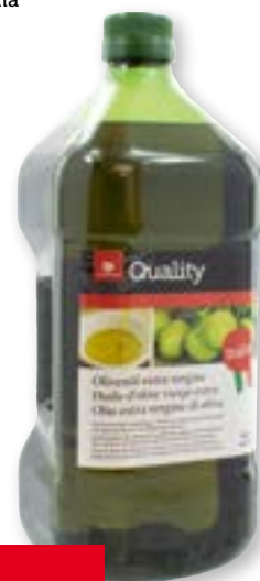
Olio di oliva extra vergine Italia