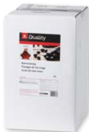
Aceto di vino rosso 10 l