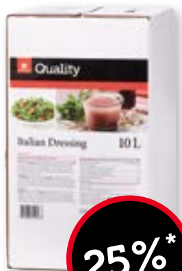
Italian Dressing 10 l