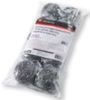
Paglietta in inox