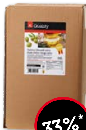
Olio di oliva extra vergine Spagna 10 l