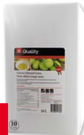
Olio di oliva extra vergine Italia 10 l