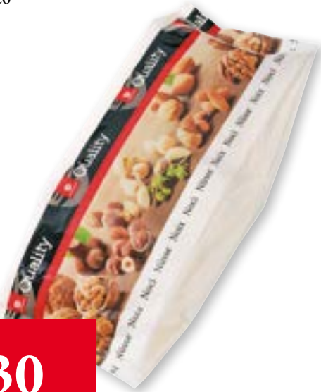
Noce di cocco grattugiata