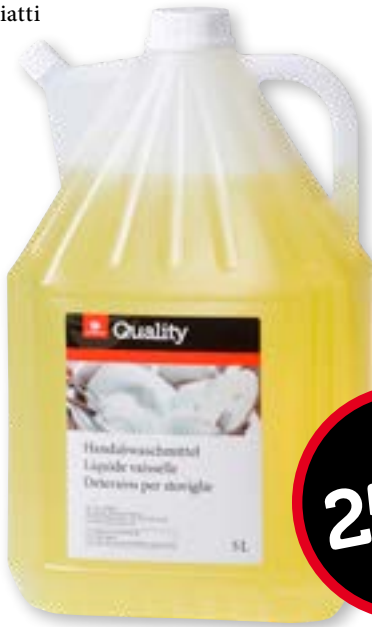
Detersivo per piatti