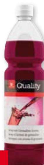
Sciroppo di granatina 11