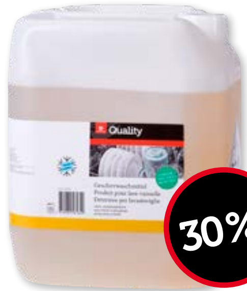
Detersivo per lavastoviglie senza cloro