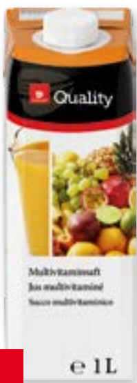
Multivitamine 12 x 11