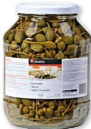
Capperi con gambo