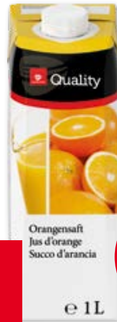
Succo d'arancia 12 x 1 l