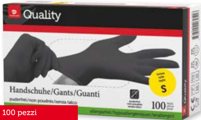
Guanti monouso in nitrile taglia S-XL neri