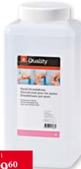
Disinfettante per mani