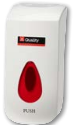
Distributore per sapone e disinfettante