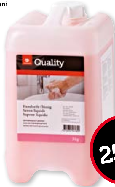
Sapone per mani ricarica