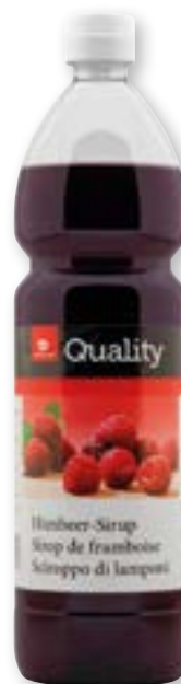
Sciroppo di lamponi 11