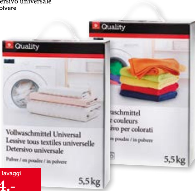
Detersivo universale in polvere