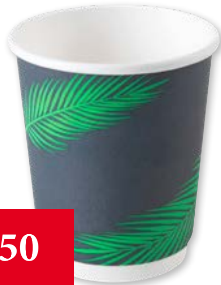
Bicchieri a doppia parete To Go FSC 2 dl