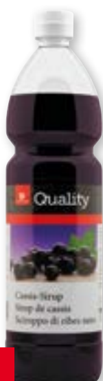
Sciroppo di ribes nero 11