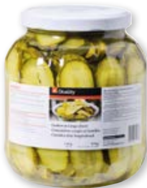
Cetrioli a fette longitudinali