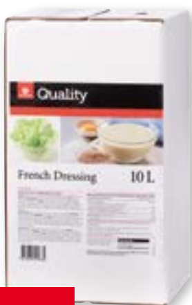
French Dressing 10 l