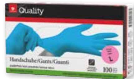
Guanti monouso in nitrile taglia S-XL blu