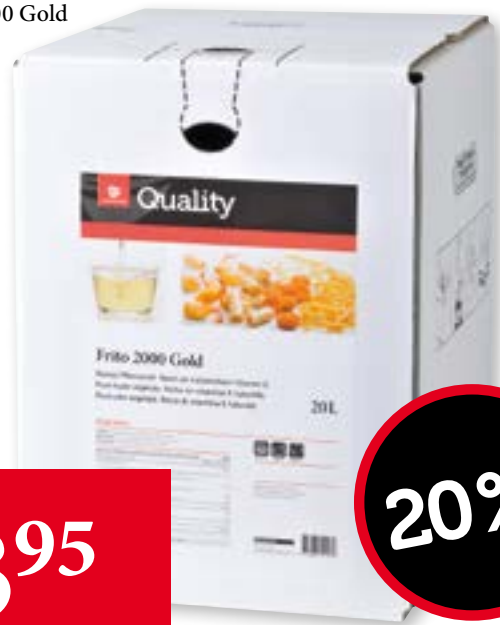
Frito 2000 Gold 20 l