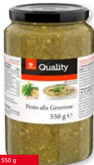
Pesto alla Genovese