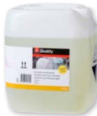
Detersivo per lavastoviglie con cloro