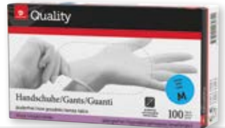
Guanti monouso in vinile taglia S-XL bianchi