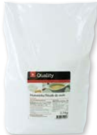
Quality Amido di mais