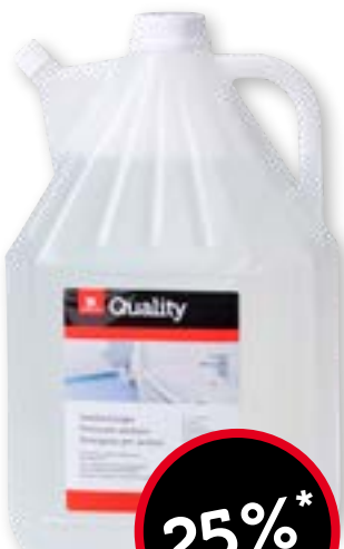
Detergente per sanitari