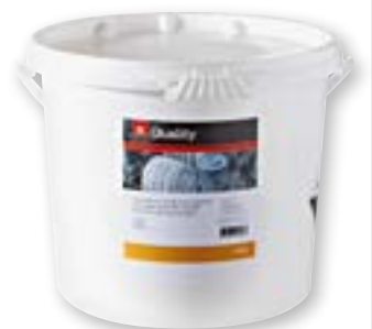
Detersivo per lavastoviglie in granuli