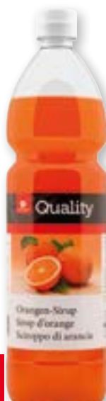
Sciroppo di arancia 11