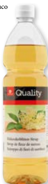
Sciroppo di fiori di sambuco 11