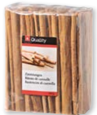
Bastoncini di cannella 15 cm