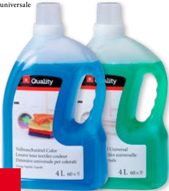
Detersivo universale liquido