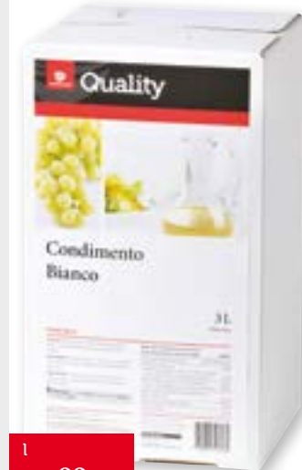
Condimento Bianco Aceto bianco 3 l