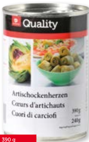
Artischockenherzen 8-10 Stück 6 x 390 g