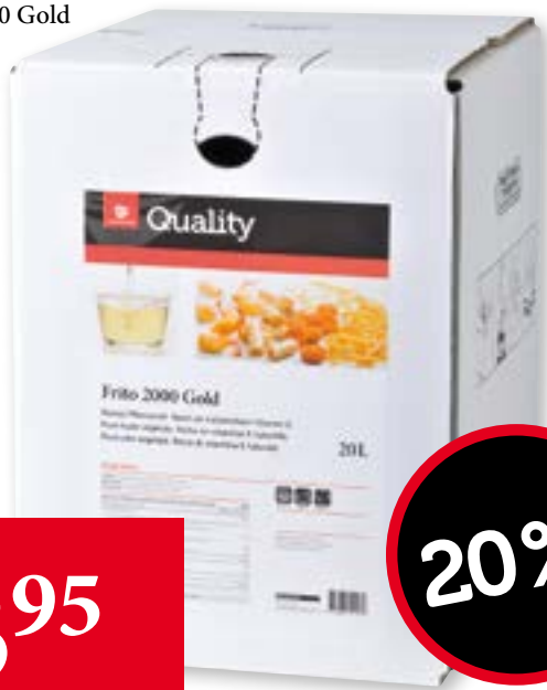
Frito 2000 Gold 20 l