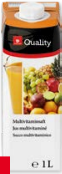
Multivitamin 12 x 1l