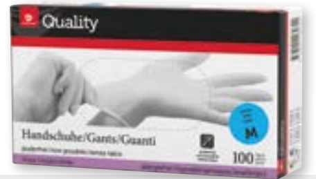
Einweghandschuhe Vinyl Grösse S-XL weiss