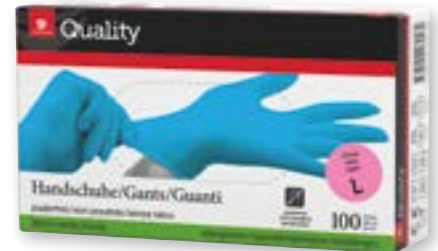
Einweghandschuhe Nitril Grösse S-XL blau