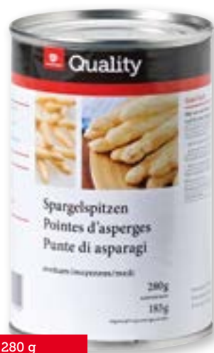
Spargelspitzen medium 12 x 280 g