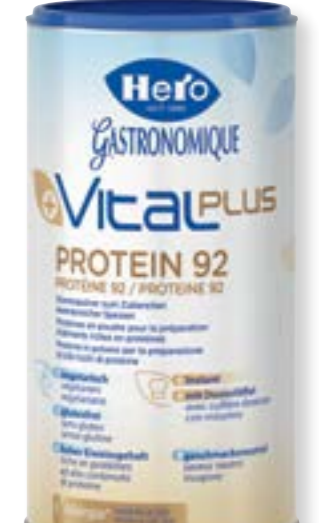
N° art. 681910 Hero Vitalplus Proteina