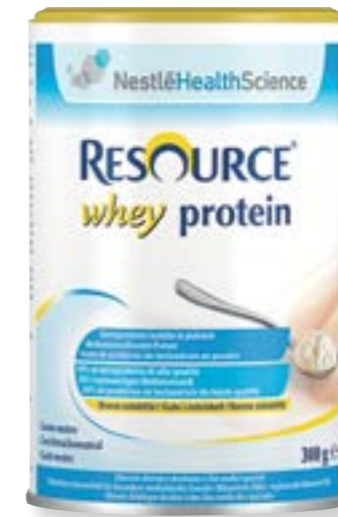
N° art. 248008 Resource Whey Proteina al naturale