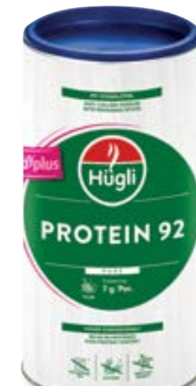
N° art. 392290 Hügli Pure Cura Plus Protein 92