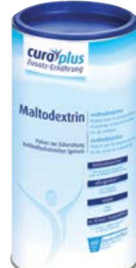
N° art. 392140 Hügli Pure Cura Plus Maltodestrina