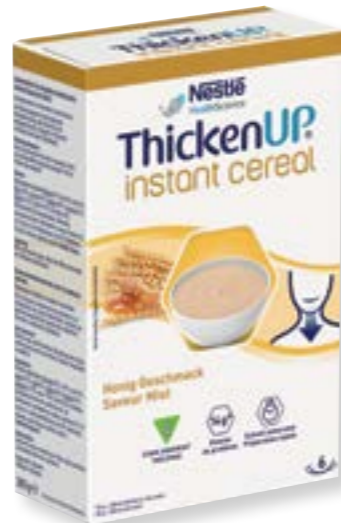
N° art. 390030 Resource Instant Cereal