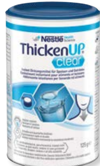
N° art. 248006 Resource ThickenUp Clear al naturale