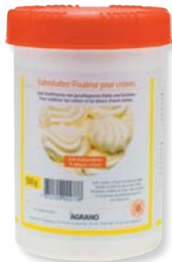
N° art. 591385 Agrano Legante per gelati, panna e salse