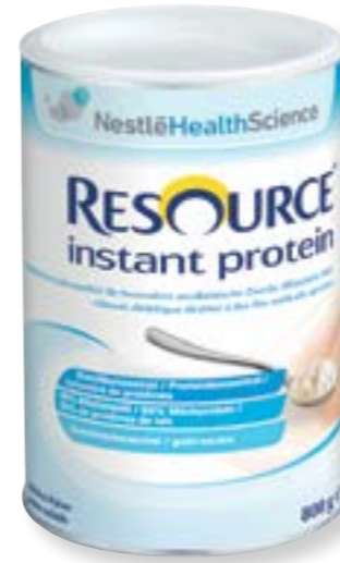
N° art. 248005 Resource Instant Protein al naturale