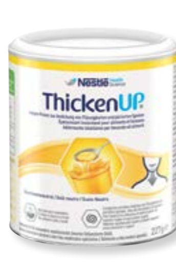
N° art. 248007 Resource ThickenUp al naturale