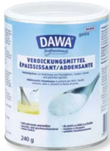
N° art. 117310 Dawa Addensante