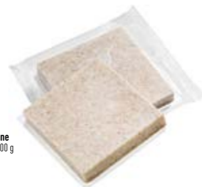
N° art. 004970 Smoothfood Pane cartone da 48 x 100 g

Tagliare il pane ancora surgelato, spalmare con burro e marmellata, tagliare a tartine, lasciare scongelare e servire a temperatura ambiente... come piacevole colazione o cena con un sovrappiù di proteine.