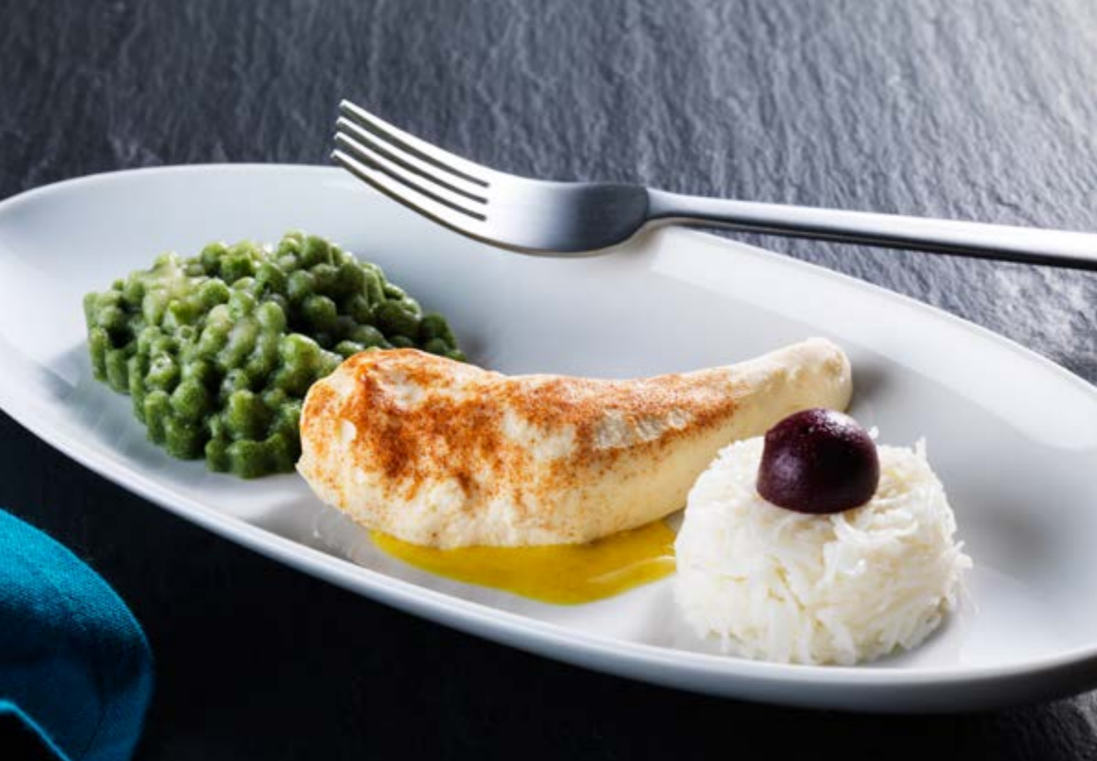
N° art. 004007 Sander Gourmet Omelette in purea, SG cartone da 25 x 70 g