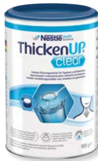
N° d'art. 390020 Resource ThickenUp Clear neutre