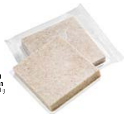
N° d'art. 004970 Smoothfood Pain carton de 48 x 100 g

Tartiner du beurre doux et de la confiture sur du pain facile à déglutir surgelé, le couper en fines tranches, le décongeler et le servir à température ambiante... pour un petit-déjeuner ou un souper attrayant - avec le petit plus en protéines!