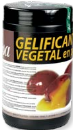
N° d'art. 358541 Gélifiant végétal