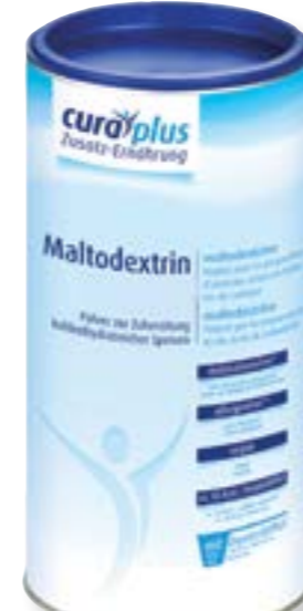
N° d'art. 392140 Hügli Pure Cura Plus Maltodextrine