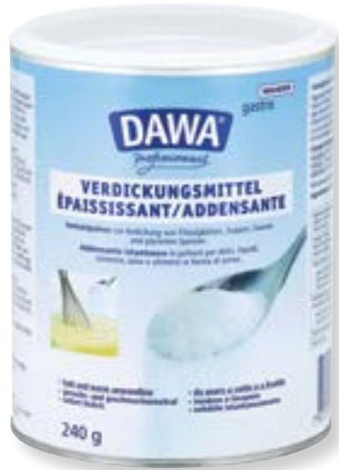
N° d'art. 117310 Dawa épaississant