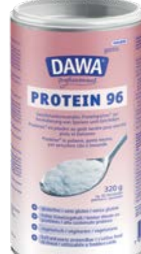
N° d'art. 580220 Dawa Protein 96