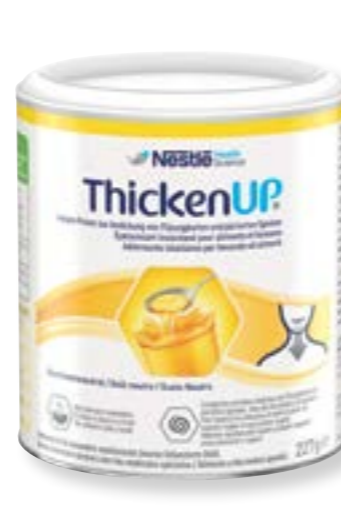
N° d'art. 248007 Resource ThickenUp neutre