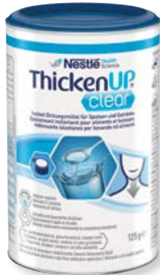
N° d'art. 248006 Resource ThickenUp Clear neutre