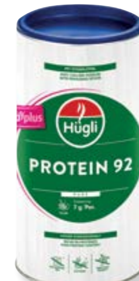
N° d'art. 392290 Hügli Cura Plus Protein 92