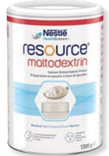
N° d'art. 390010 Resource Maltodextrine