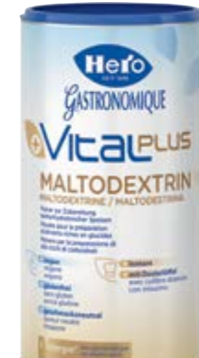
N° d'art. 681920 Hero Vitalplus Maltodextrine