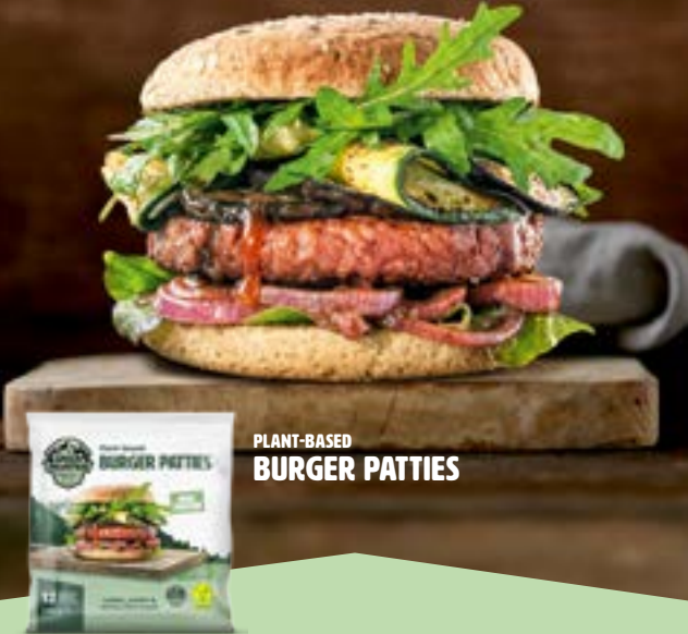
PLANT-BASED BURGER PATTIES