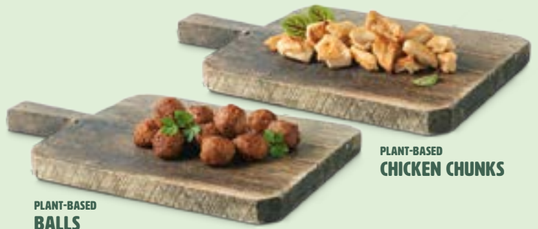
PLANT-BASED CHICKEN CHUNKS

SULL'INTERO ASSORTIMENTO THE GREEN MOUNTAIN