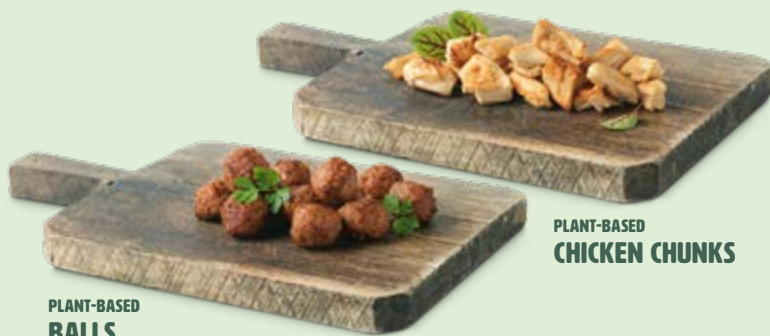
PLANT-BASED CHICKEN CHUNKS

AUF DAS GESAMTE THE GREEN MOUNTAIN SORTIMENT.