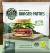
PLANT-BASED BURGER PATTIES