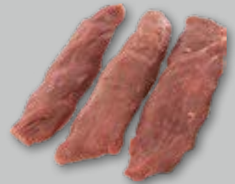
Boeuf Petite Tender (Manzo) pz da ca. 1 kg