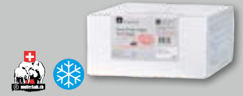
Swiss Prime Angus Beef Burger 30 x 150 g