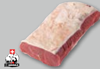
Swiss Prime Angus Entrecôte di manzo ca. 2,5 kg