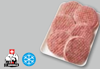
Swiss Prime Angus Burger 30 x 200 g