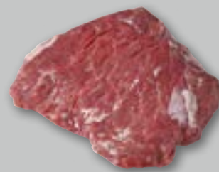
Boeuf Araignée Manzo ca. 1 kg