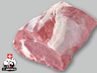
Swiss Prime Angus Reale di manzo ca. 2,5 kg

La carne Swiss Prime Angus Beef proviene da aziende che allevano vacche nutrici ed è molto famosa per il suo colore rosso vivo e la sua marmorizzazione. Inoltre, è a fibra sottile, quindi, particolarmente tenera e succosa.