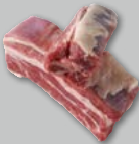
Short Ribs di manzo ca. 1 kg