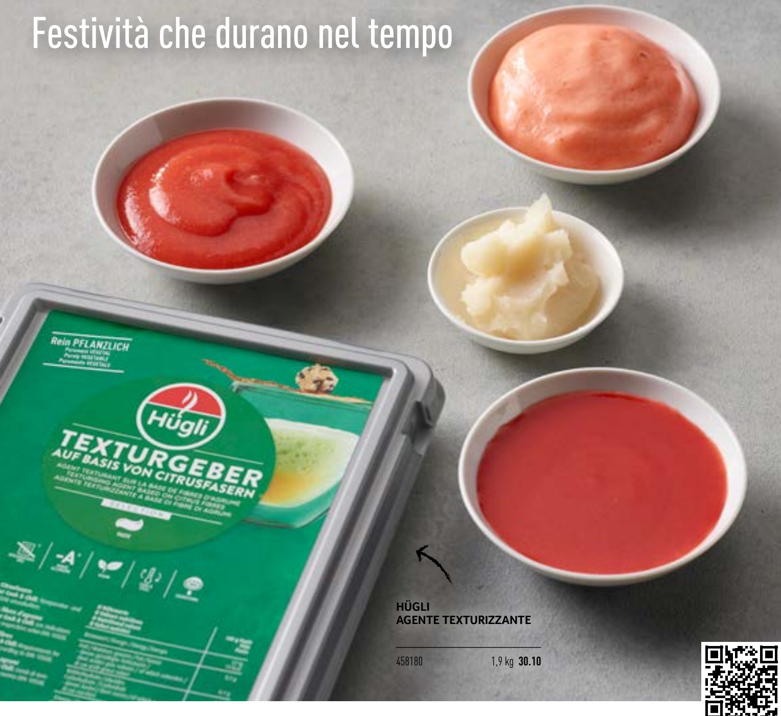
HÜGLI AGENTE TEXTURIZZANTE