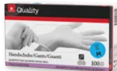
N° art. 975820 Guanti monouso in vinile taglia M bianchi