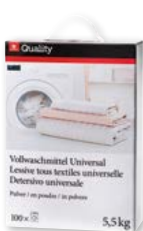
N° art. 815818 Detersivo universale in polvere