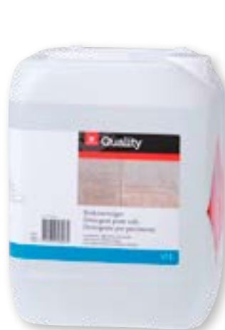
N° art. 815612 Detergente per pavimenti