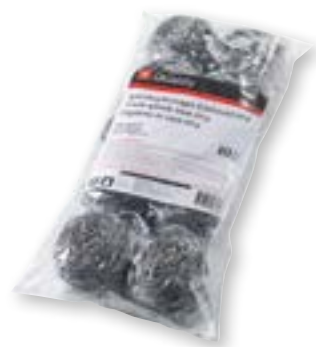
N° art. 973483 Paglietta in inox