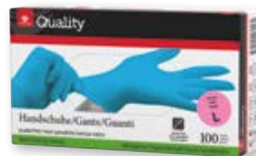
N° art. 975752 Guanti monouso in nitrile taglia L blu