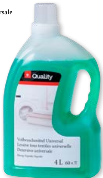
N° art. 815816 Detersivo universale liquido