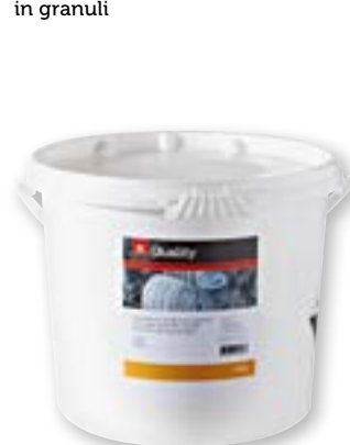
N° art. 815634 Detersivo per lavastoviglie in granuli