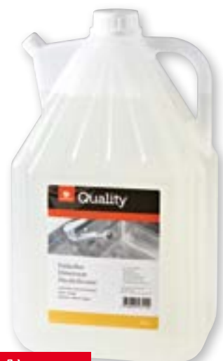
N° art. 815607 Anticalcare