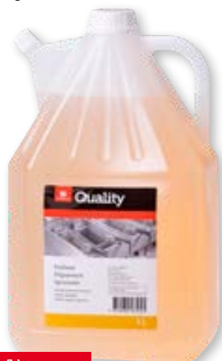
N° art. 815602 Sgrassatore