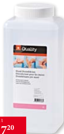
N° art. 815740 Disinfettante per mani