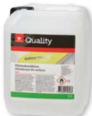
N° art. 815645 Disinfettante per superfici