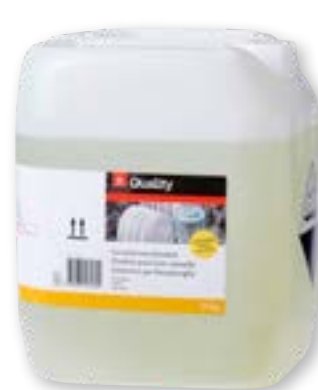
N° art. 815631 Detersivo per lavastoviglie con cloro