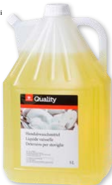
N° art. 815795 Detersivo per piatti