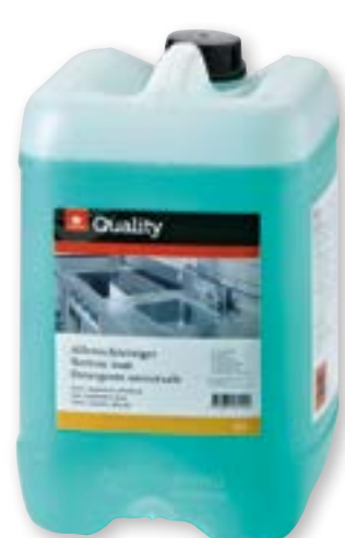
N° art. 815601 Detergente universale