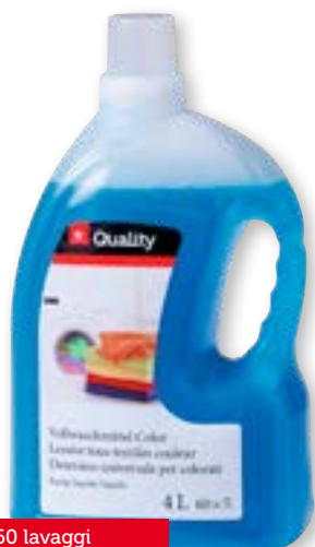
N° art. 815815 Detersivo universale liquido, Color