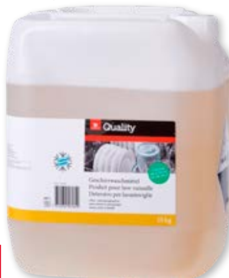
N° art. 815633 Detersivo per lavastoviglie senza cloro