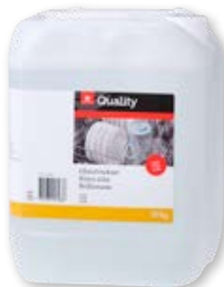
N° art. 815635 Brillantante acido