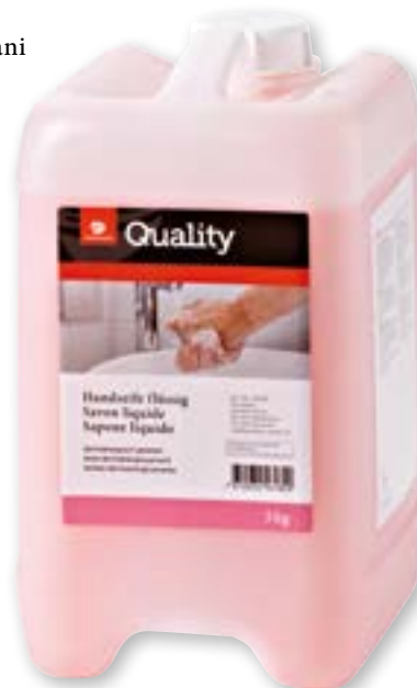
N° art. 815700 Sapone per mani ricarica