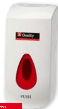
N° art. 815624 Distributore per sapone e disinfettante