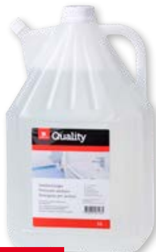
N° art. 815614 Detergente per sanitari