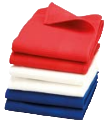
Torchon Nid d'abeille 48 x 90 cm 3 pièces