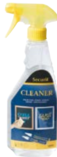
Securit Nettoyant pour marqueur-craie