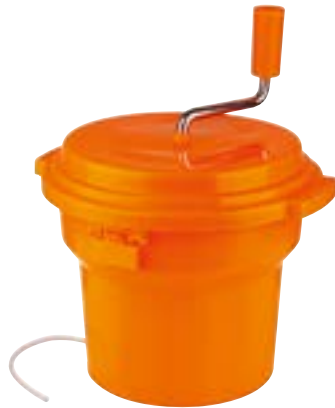
Essoreuse à salade 9,5 l