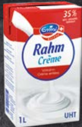
Emmi Crème entière UHT, 35%, 1 l