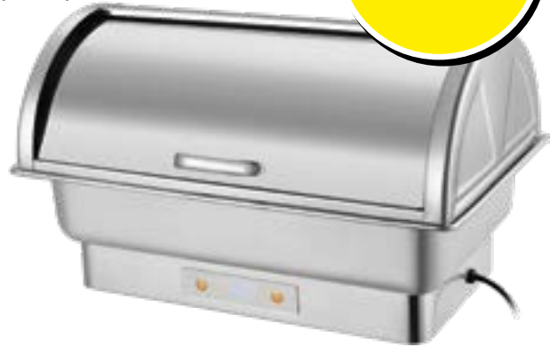
Chafing Dish GN1/1 Rolltop électrique