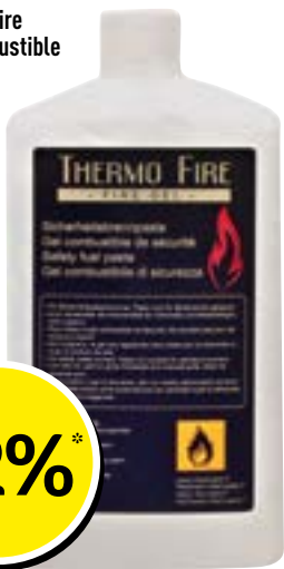
Thermo Fire Gel combustible 4 x 1l