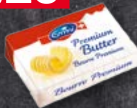
Emmi Portions de beurre 96x10 g