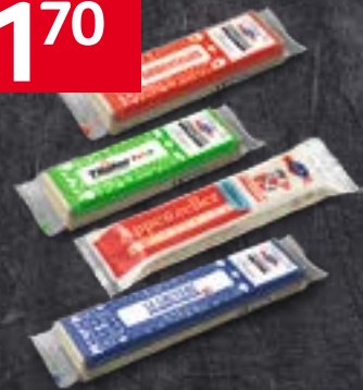
Emmi Portions de fromage assorties, 37 x 27 g