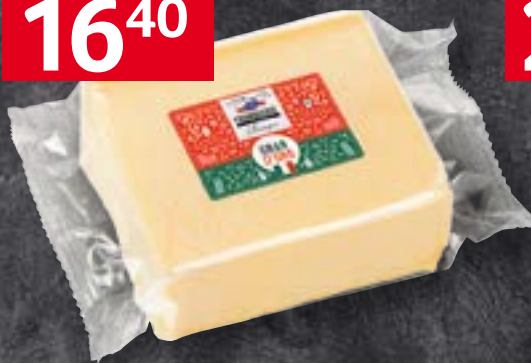
Emmi Gran d'Oro Block, 1 kg