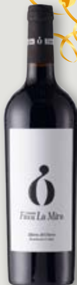
Tamaral Finca La Mira