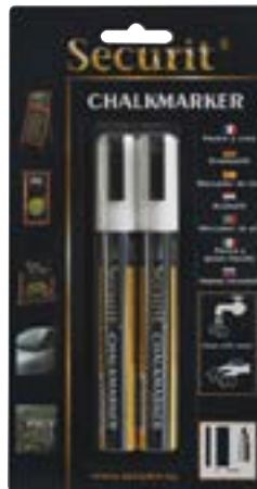
Securit Kreidemarker weiss 2 - 6 mm