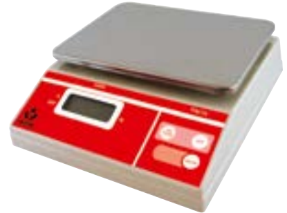
Viktor Tischwaage bis 15 kg/5 g