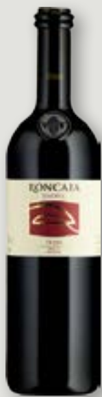
Roncaia Merlot Riserva