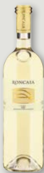
Roncaia Merlot Bianco