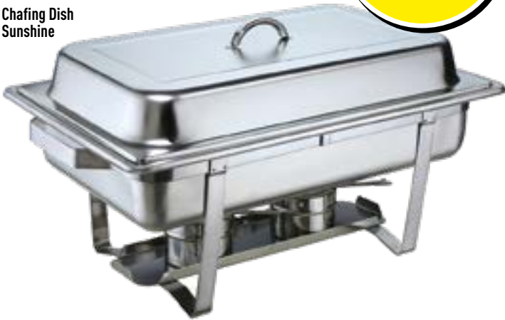
Chafing Dish Sunshine