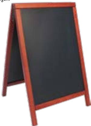
Securit Duplo Gehwegtafel 55 x 85 cm mahagoni