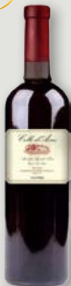
Colle d'Avra Rosso