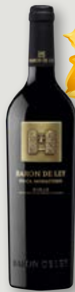
Baron de Ley Finca Monasterio