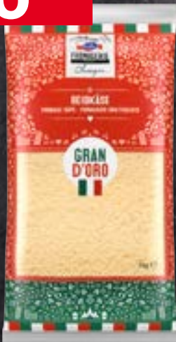
Emmi Gran d'Oro körnig gerieben, 1 kg