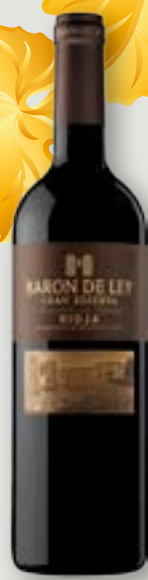
Baron de Ley Gran Reserva