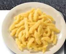
Eier-Spätzli TK 2 × 2.5 kg | Art.: 032890