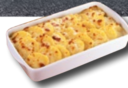
Kartoffelgratin TK 5 × 1.5 kg | Art.: 032970