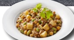
VEGIC Indian Coconut Dal TK 5 × 1.5 kg | Art.: 038820