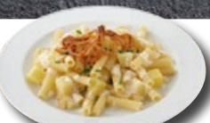
Älpermakkaroni TK 5 × 1.5 kg | Art.: 032930