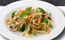
Gemüse-Spätzlipfanne TK 5 × 1.5 kg | Art.: 032920