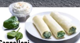
Cannelloni Ricotta e Spinaci TK 1 × 5 kg | Art.: 005504