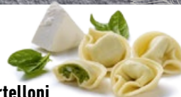
Tortelloni Ricotta & Spinaci TK 2 × 2 kg | Art.: 005520