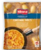
Rösti 10 × 400 g | Art.: 448053