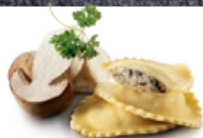
Tortelli Steinpilze TK 2 × 2 kg | Art.: 005530