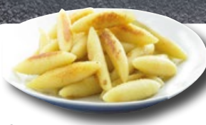
Schupfnudeln TK 2 × 2.5 kg | Art.: 032860