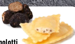
Agnolotti Trüffel Aestivum TK 2 × 2 kg | Art.: 006520