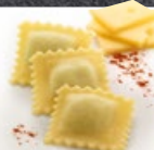
Ravioli Raclette TK 2 × 2 kg | Art.: 039050