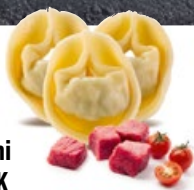
Tortellini Carne TK 1 × 10 kg | Art.: 005600