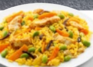
Nasi Goreng TK 5 × 1.5 kg | Art.: 032750