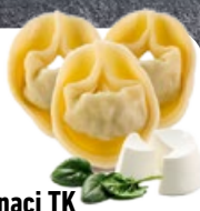
Tortellini Ricotta & Spinaci TK 1 × 10 kg | Art.: 039120