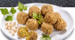
VEGIC Falafel TK 5 × 1 kg | Art.: 038390