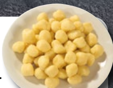
Kartoffel- gnocchi TK 2 × 2.5 kg | Art.: 032880