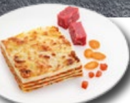
Lasagne Bolognese TK 2 × 15 x 300 g | Art.: 005500