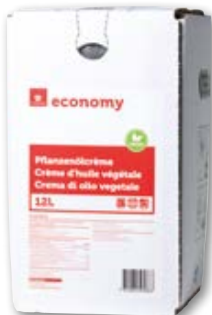
Crème d'huile végétale Bibox 12 litres