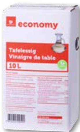
Vinaigre de table 10 l