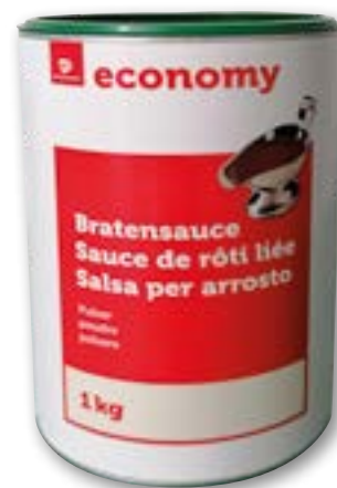
Sauce de rôti liée