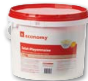
Mayonnaise à salade