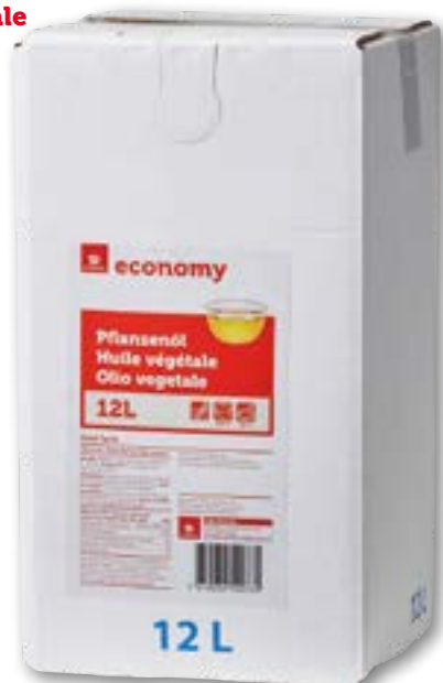
Huile végétale 12 l