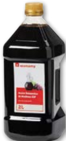
Vinaigre balsamique de Modena