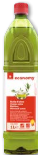
Huile d'olive extra vierge Espagne