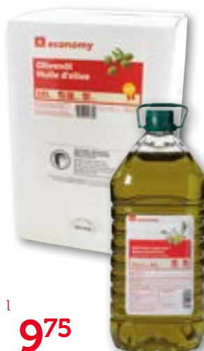
Huile d'olive extra vierge Espagne 10 l 5 l