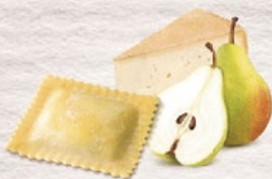
Ravioli Formaggio e pere