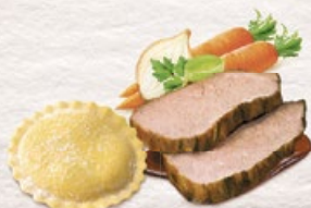
Medaglioni al Brasato