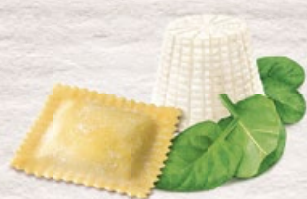
Ravioli Ricotta e spinaci