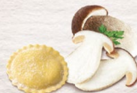
Medaglioni ai Porcini