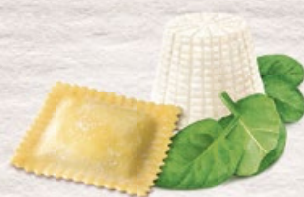
Ravioli Ricotta et épinards