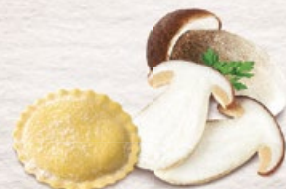
Medaglioni aux Bolets