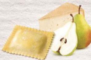
Ravioli Fromage et poires