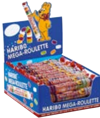
N° art. 350831 Haribo Mega Roulette 40 x 45 g