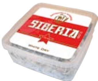
N° art. 700980 Siberia (box da 500 g) 80 Red White Dry