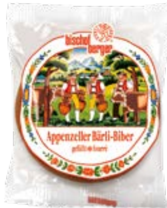
N° art. 106841 Appenzeller Bärtl-Biber 10 x 75 g