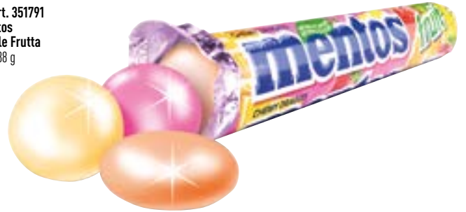
N° art. 351791 Mentos Single Frutta 40 x 38 g