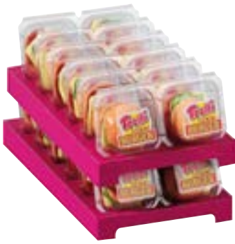
N° art. 353840 Trolli Burger gigante 12 x 12 pezzi