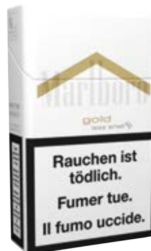
N° art. 702148 Marlboro Gold Box Gold Box