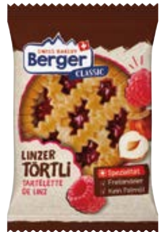
N° art. 108161 Berger Tortina di Linz 10 x 74 g