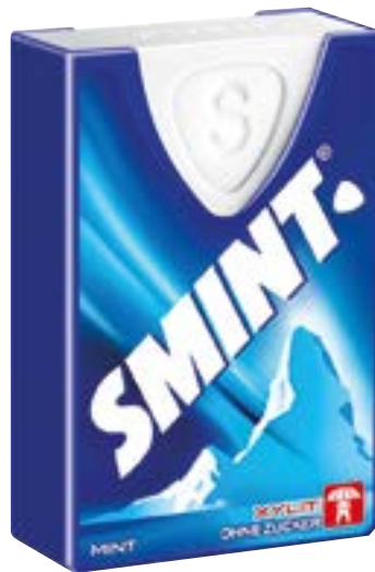
N° art. 356651 Smint Bonbons 12 x 8 g