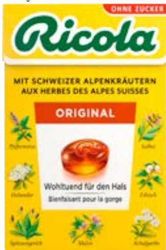
N° art. 354285 Ricola Original alle erbe senza zucchero 20 x 50 g