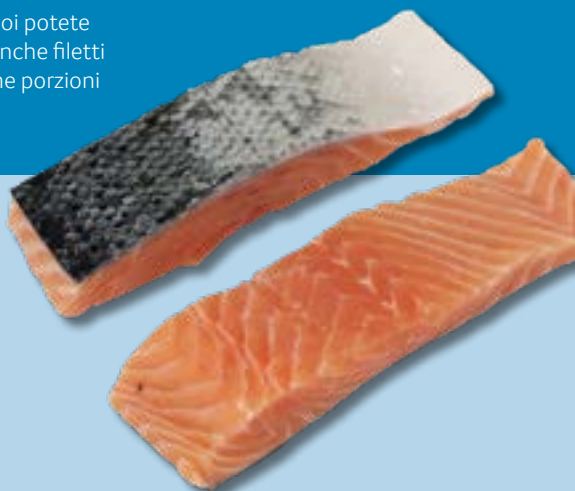
Medaglione di salmone con o senza pelle, povero di lische, disponibile in diverse porzioni