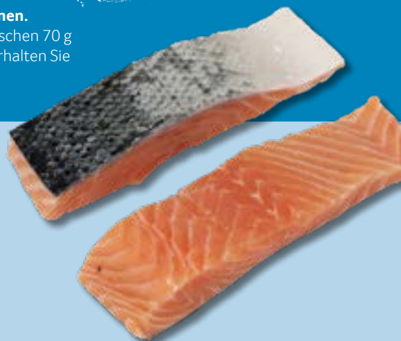
Lachs Medaillon mit oder ohne Haut, grätenarm, in verschiedenen Portionsgrößen verfügbar