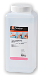
Désinfectant pour les mains