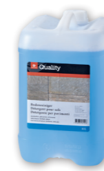
Détergent pour sols

Dosage Non dilué Utilisation Convient également parfaitement au nettoyage des surfaces en acier chromé. Vaporiser et sécher avec un chiffon non pelucheux.