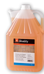
Savon noir liquide

Dosage Pour grandes surfaces: 1-3 dl / 10 l d'eau. Pour le nettoyage d'entretien, utiliser non dilué sur des éponges/chiffons. Utilisation Pour tous les revêtements de sol résistants à l'eau en plastique, linoléum, Colovinyl, pierre naturelle et artificielle, caoutchouc, surfaces peintes ou laquées et armatures.