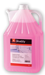
Détergent pour sanitaires

Dosage Détartrant: utiliser non dilué. Détergent sanitaire: diluer 1:1. Utilisation Appliquer le produit non dilué à l'aide d'un vaporisateur ou d'un chiffon, laisser agir quelques minutes puis rincer abondamment à l'eau. L'utilisation de chiffons en microfibrilles renforce considérablement l'efficacité du nettoyage et réduit la consommation de produit jusqu'à 50%.