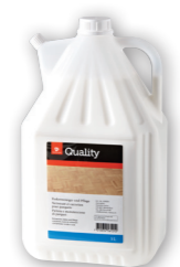
Détergent pour parquet

Dosage Pour grandes surfaces: 1-3 dl / 10 l d'eau. Pour le nettoyage d'entretien, utiliser non dilué sur des éponges/chiffons. Utilisation Pour tous les revêtements de sol résistants à l'eau en plastique, linoléum, Colovinyl, pierre naturelle et artificielle, caoutchouc, surfaces peintes ou vernies et armatures.