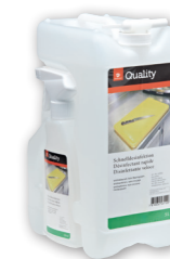
Désinfectant des surfaces

Dosage Non dilué Utilisation Vaporiser sur les surfaces préalablement nettoyées, laisser sécher et ne pas rincer. Temps d'action: au moins 1 minute. N'utiliser que dans des locaux bien aérés et sur de petites surfaces (< 1 m²).