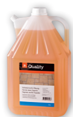
Savon noir liquide

Dosage 1-3 dl / 10 l d'eau Utilisation Si nécessaire, procéder à un balayage humide. Appliquer la solution avec un mop ou un chiffon. Concentré pour un entretien complet.