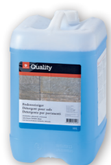
Détergent pour sols

Dosage Non dilué Utilisation Vaporiser sur les surfaces préalablement nettoyées, laisser sécher et ne pas rincer. Temps d'action: au moins 1 minute. N'utiliser que dans des locaux bien aérés et sur de petites surfaces (< 1 m²).