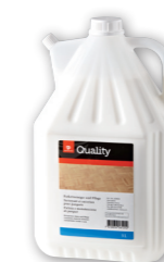
Détergent pour parquet

Dosage Pour grandes surfaces: 1-3 dl / 10 l d'eau. Pour le nettoyage d'entretien, utiliser non dilué sur des éponges/chiffons. Utilisation Pour tous les revêtements de sol résistants à l'eau en plastique, linoléum, Colovynil, pierre naturelle et artificielle, caoutchouc, surfaces peintes ou laquées et armatures.