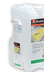
Désinfectant des surfaces

Dosage Non dilué Utilisation Vaporiser sur les surfaces préalablement nettoyées, laisser sécher et ne pas rincer. Temps d'action: au moins 1 minute. N'utiliser que dans des locaux bien aérés et sur de petites surfaces (< 1 m²).