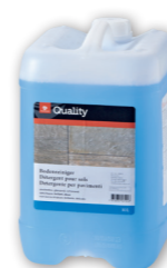
Détergent pour sols

Dosage Détartrant: utiliser non dilué. Détergent sanitaire: diluer 1:1. Utilisation Appliquer le produit non dilué à l'aide d'un vaporisateur ou d'un chiffon, laisser agir quelques minutes puis rincer abondamment à l'eau. L'utilisation de chiffons en microfibras renforce considérablement l'efficacité du nettoyage et réduit la consommation de produit jusqu'à 50%.