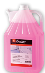
Détergent pour sanitaires

Dosage Concentré ou dilué à raison de 2,5 dl pour 5 dl d'eau Utilisation Respecter les indications du fabricant de l'appareil. Sauf indication contraire, remplir l'appareil de détartrant concentré ou dilué selon le degré d'entartrage et laisser reposer jusqu'à 1 heure. Sinon, traiter avec un chiffon imbibé. Toujours rincer abondamment à l'eau. Ne pas utiliser avec d'autres produits. Répéter l'opération si nécessaire. Attention à l'émail.