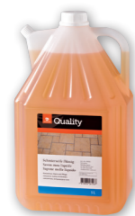
Savon noir liquide

Dosage Pour salissures courantes: 1-2 dl / 10 l d'eau. En cas de salissures importantes: utiliser non dilué. Utilisation Nettoyant universel idéal pour les sols en clinker et sols en pierre naturelle, carrelages, surfaces en bois, matières plastiques, portes, armoires, salle de bain, toilettes. Étant du savon pur, ne convient pas pour les vitres et les miroirs. Bien rincer les surfaces nettoyées à l'eau.